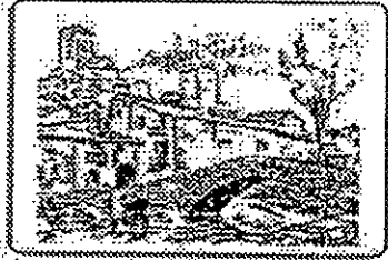
Asociación Amigos de Montaña